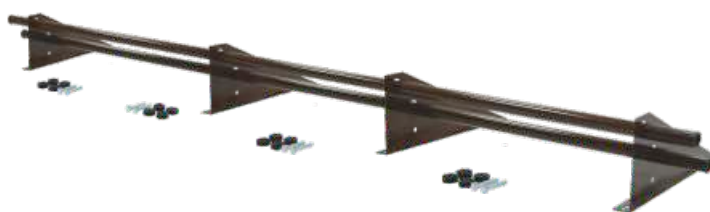
Снегозадержатель Optima Плюс 3 м