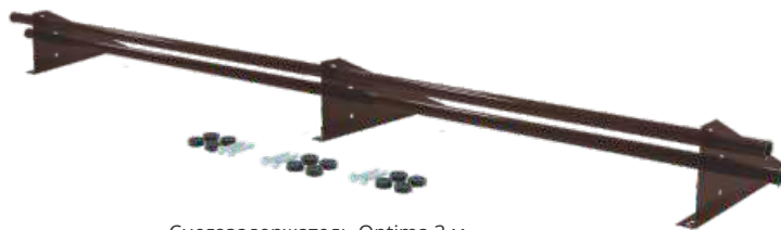
Снегозадержатель Optima 3 м