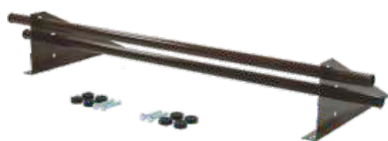
Снегозадержатель Optima 1 м